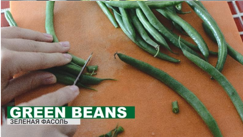
GREEN BEANS ЗЕЛЕНАЯ ФАСОЛЬ