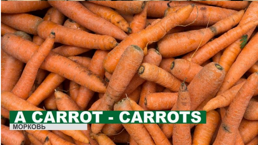
A CARROT - CARROTS МОРКОВЬ