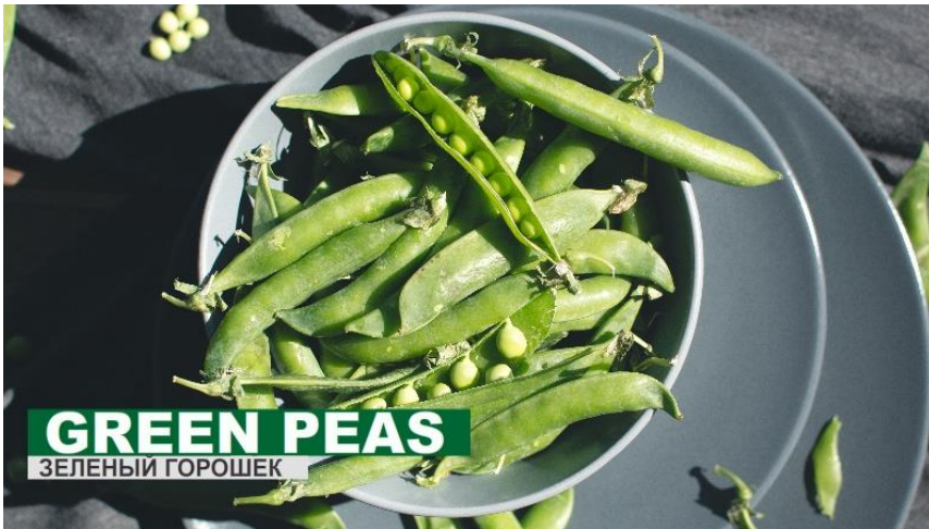
GREEN PEAS ЗЕЛЕНЬИ ГОРОШЕК