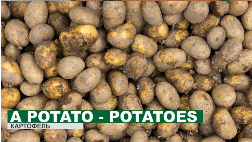
A POTATO - POTATOES КАРТОФЕЛЬ